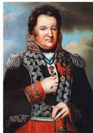
Jan Henryk Dąbrowski (*1755 †1818) był jednym z najwybitniejszych polskich dowódców. Brał udział między innymi w powstaniu kościuszkowskim – wstąpił się podczas obrony Warszawy i walk na terenie Wielkopolski.

W krótkim czasie do Legionów zgłosiło się około siedmiu tysięcy ochotników. Byli to emigranci oraz Polacy wcieleni do armii austriackiej, którzy dostali się do niewoli lub sami przeszli na stronę Francji. Wiązali oni duże nadzieje z powstaniem Legionów. Liczyli, że oddziały pod wodzą generała Dąbrowskiego zapoczątkują zwycięską walkę o wolną Polskę.