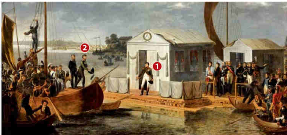
Spotkanie Napoleona 1 z carem Aleksandrem I 2 w Tylży zostało przedstawione na obrazie z początku XIX wieku. Władcy prowadzili rozmowy na tratwie zacumowanej na rzece Niemen, która stanowiła granicę między podbitymi przez Francję Prusami a Rosją.